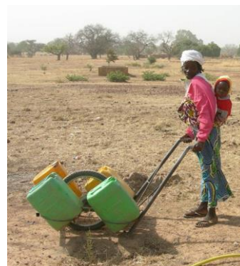
Photos : A gauche, les charrettes, à droite un pousse-pousse