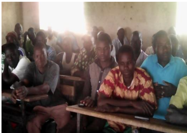
Photo2 : Une vue des participants à la session de mise en place des CGPE

Chaque comité mise en place est composé de cinq (5) personnes à savoir : Un (1) président, un (1) secrétaire, un (1) trésorier, deux (2) hygiénistes.