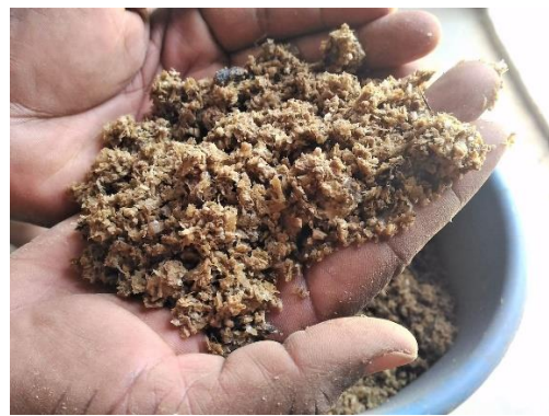
Microorganismes Efficaces (EM)

Toutes les femmes et les intervenants sur le jardin sont issus du milieu agricole et expriment leur fierté d'avoir acquis de nouveaux savoir-faire.