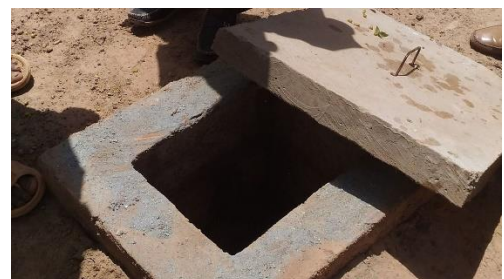
Un des 3 regards

Avec Souleymane Belemgnégré, le formateur, nous avons insisté sur la nécessité de progresser vers une comptabilité plus claire : tenter de peser ou mesurer ce qui est produit , que cela soit vendu ou consommé personnellement et abordé la gestion des investissements (ingrédients pour produits bio de traitements, maintenance des équipements) ...Bref établir à moyenne échéance un plan comptable qui puisse assurer l'autonomisation du jardin des femmes.