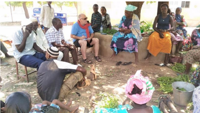
Mme Sankara rend compte de l'activité à Mil'Ecole