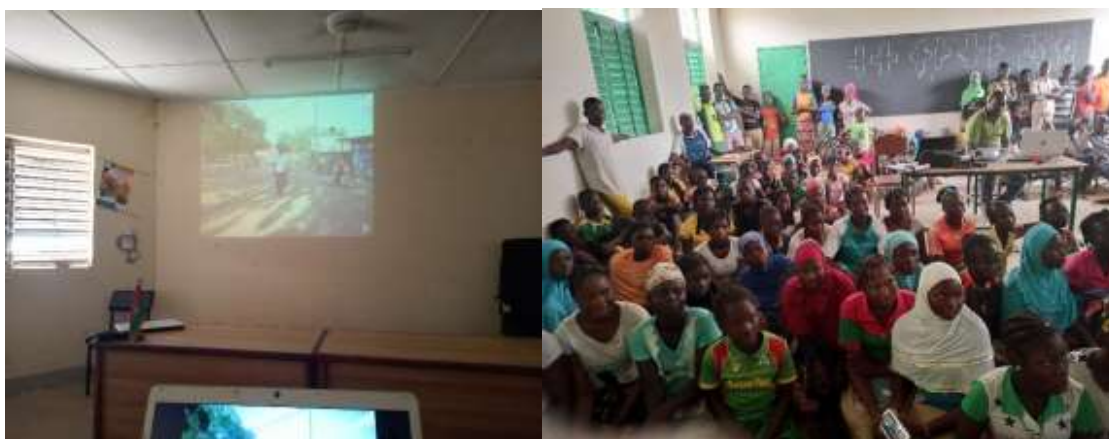
Projection de film suivie d'échanges (CEG Guirgo)

Les enseignants sont invités à relayer le message dans les classes à chaque fois que cela s'avère nécessaire et possible.