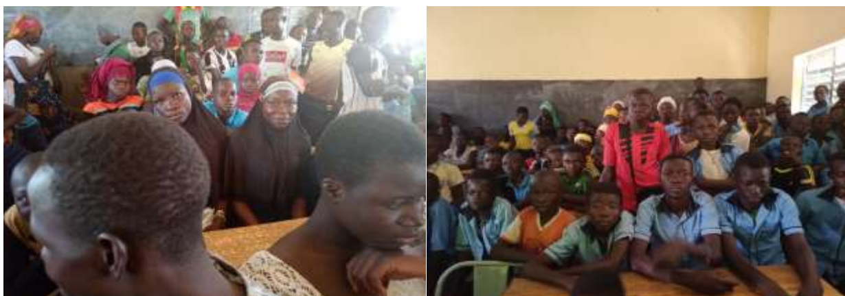
Aperçu des participants (CEG de Sourgou à gauche, CEG de Ouoro à droite.)

Ces séances de sensibilisation avaient pour principale cible, les élèves des établissements concernés. Elles réunissaient donc à cet effet, ces derniers, leurs enseignants (ceux des Sciences de la Vie et de la Terre en particulier) et les chargés de la vie scolaire.