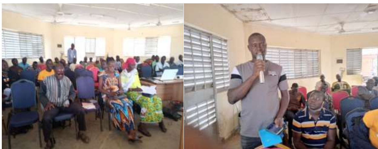
Aperçu des participants à la rencontre