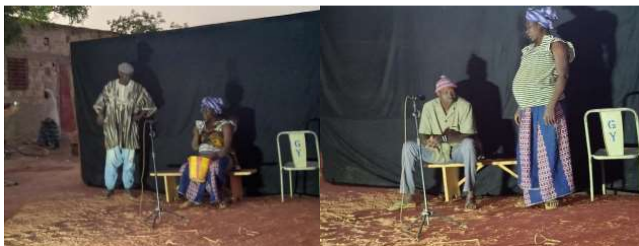
Aperçu des séances de théâtres forum