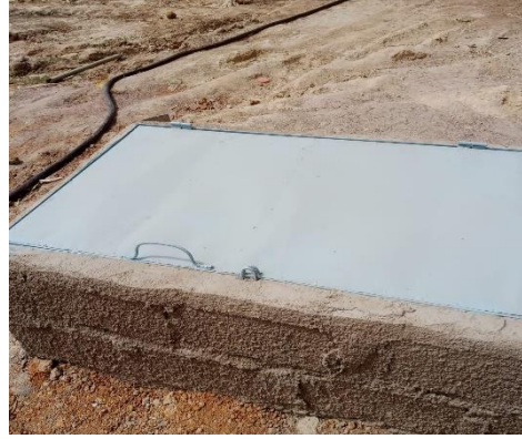
✚ Mini château de 10 000 L : installé et fonctionnel